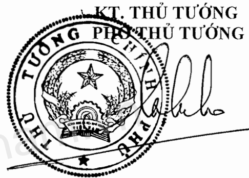
Trương Hòa Bình