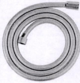
Hình 1: Mặt hàng khai báo “shower hose 1750mm-Dây sen bằng nhựa bọc inox, đường kính trong 21mm, dài 1750mm, hiệu Grohe”